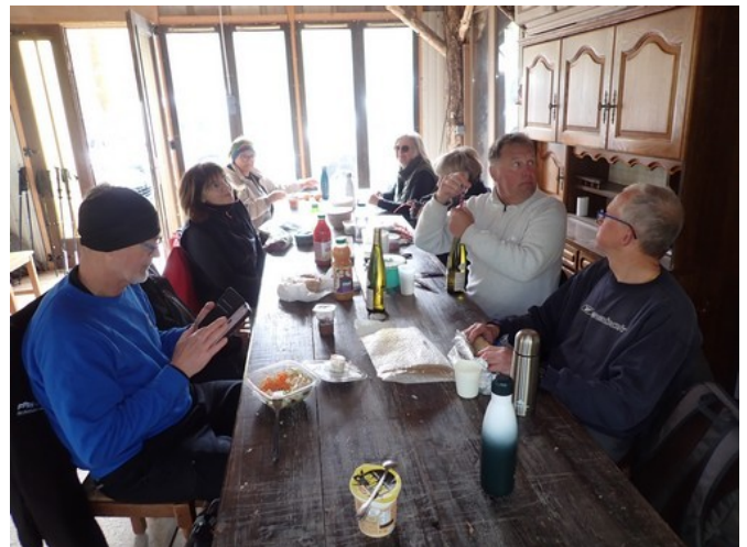
notre abri pour le casse-croûte !