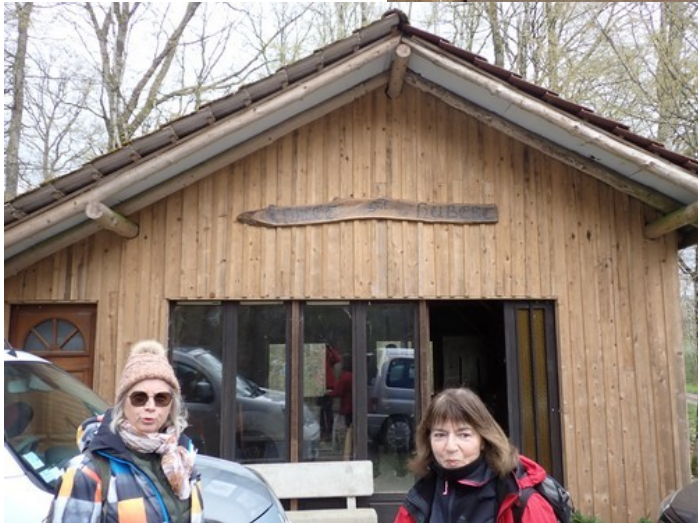
Et en face ...