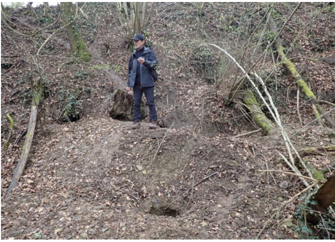
Terrain de jeux à blaireau ? Maurice essaie de les attirer ... mais calme plat ...