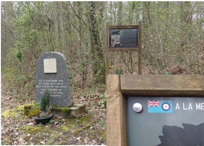
La stèle de l'aviateur ...