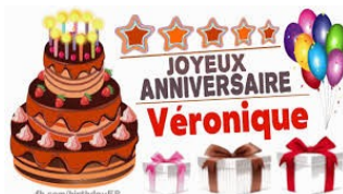
On a pas eu droit aux bougies ... ni au ballons ... Pas grave !!