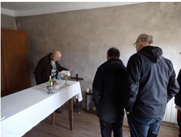
Un magnifique Christ sculpté en bois et restauré par un artisan luthier de Mirecourt ...