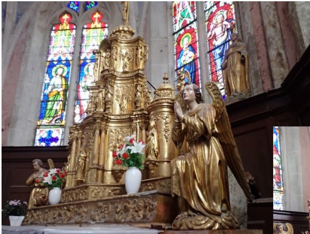
Le maître-autel doré du XVIII ième siècle.