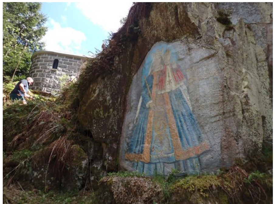
Notre-Dame de la Creuse.