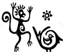
Je pencherais plutôt vers l'œuvre d'un tailleur de pierre travaillant dans la carrière ...