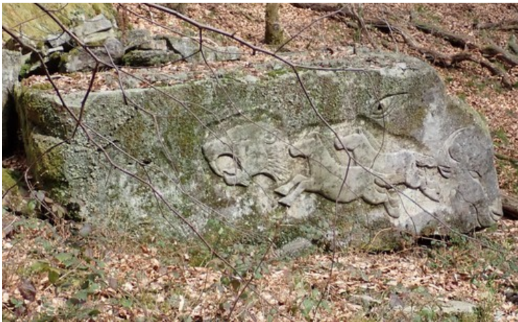
De beaux bas relief !! ou pétroglyphes !