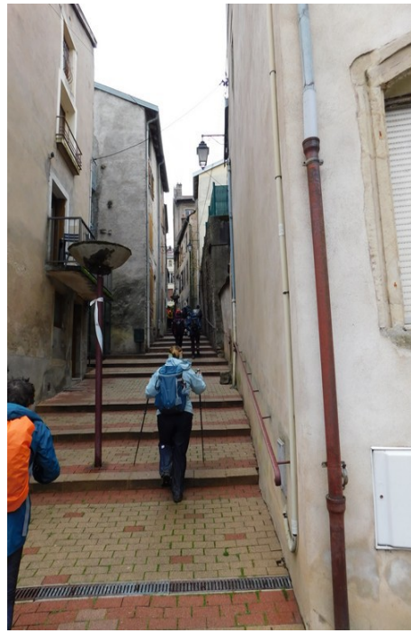
Le vieux quartier, vraiment vieux ...