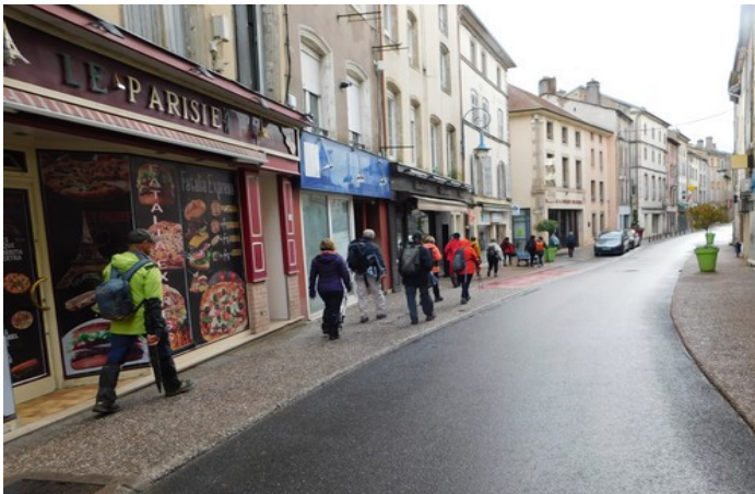
La rue principale, et ses magasins ...