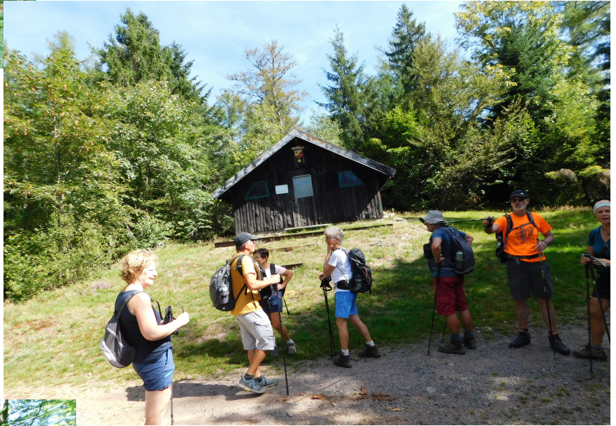
Un beau petit refuge !! Mais il est un peu tôt pour passer à table ...