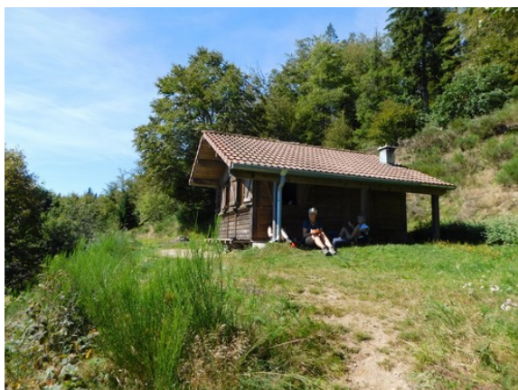
Le voici, ce beau petit refuge, idéal pour le picnic !!