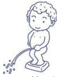
Ça amuse bien Claude en tout cas ....