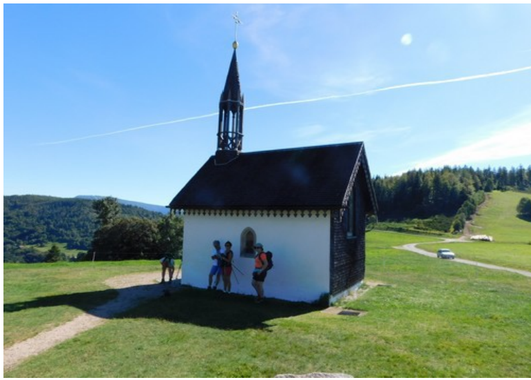
Alain est captivé par l'histoire de la chapelle ...