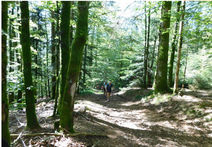
Allez, c'est reparti !