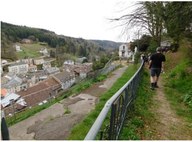
Nous retrouvons Plombières !