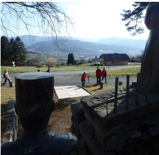
Et encore un monument à la Gloire des soldats ...

« Mais toujours pas de clés ! Angoisse !!! »