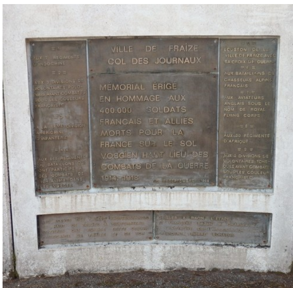
Lieu tragique pendant la guerre de 1914 ...