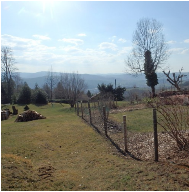
Sympa la vue.