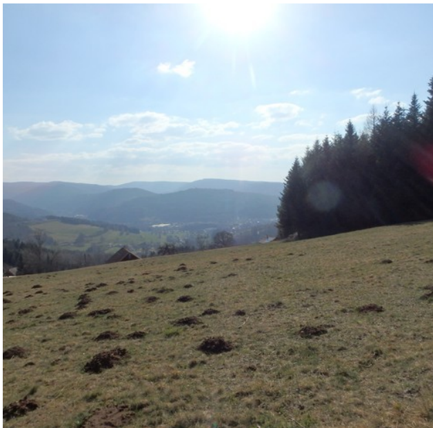
Même les taupes apprécient l'endroit !