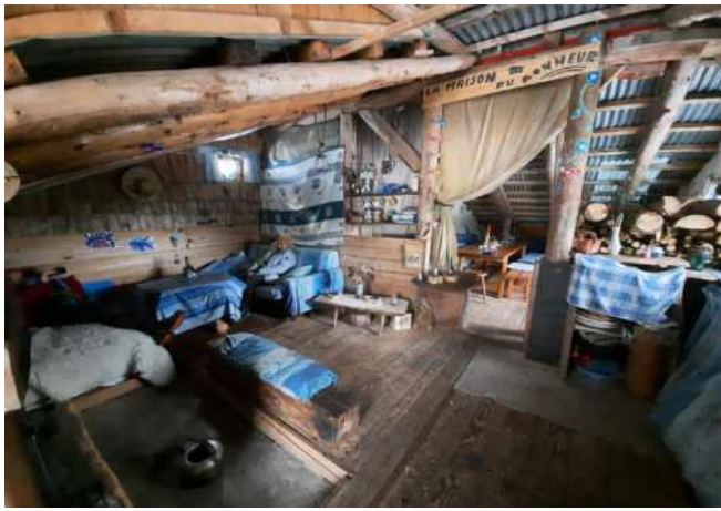
« La maison du Bonheur »