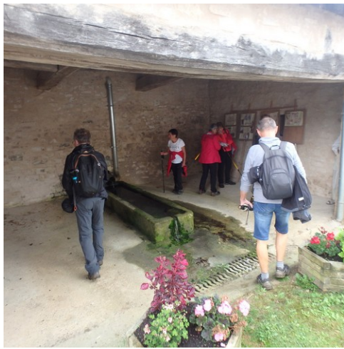
Belle petite fontaine !