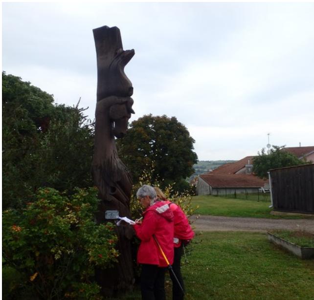
Un beau totem en bois.

Et c'est la fin de ce petit parcours de 9 kms. bien sympa ! La météo nous a finalement été favorable.