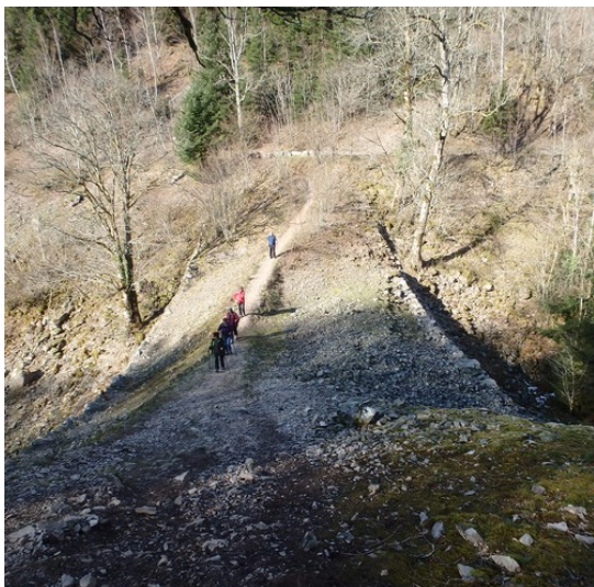
Les 4 Fées sur le pont des Fées ...