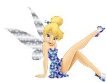
« On dit Fée belle ! »