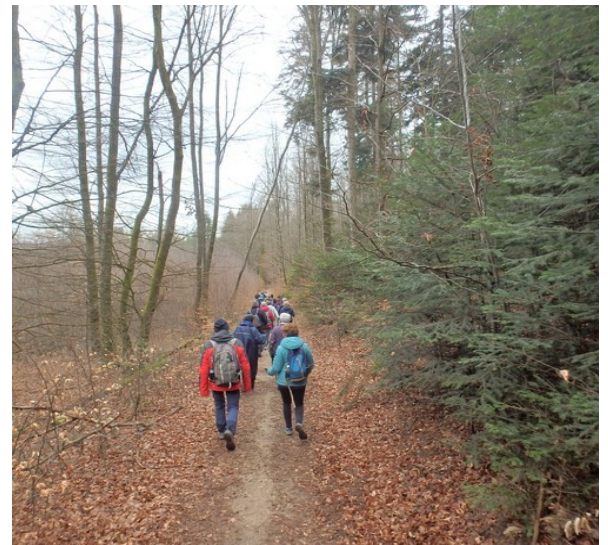
C'est parti !