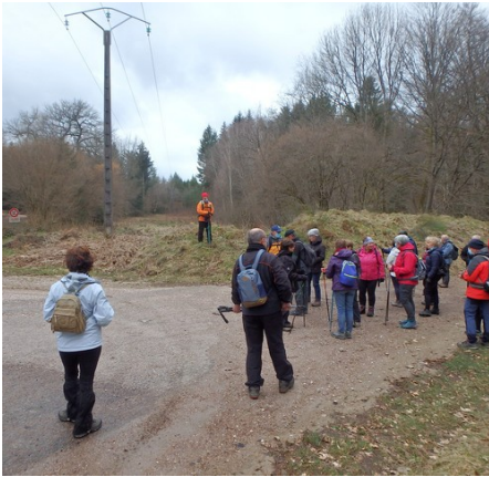
Briefing de départ.

« J'espère que ça va faire, je suis pas trop équipé ... »