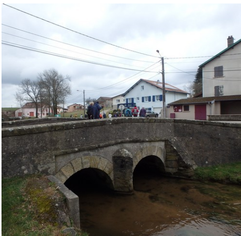
Traversée de Mossoux.