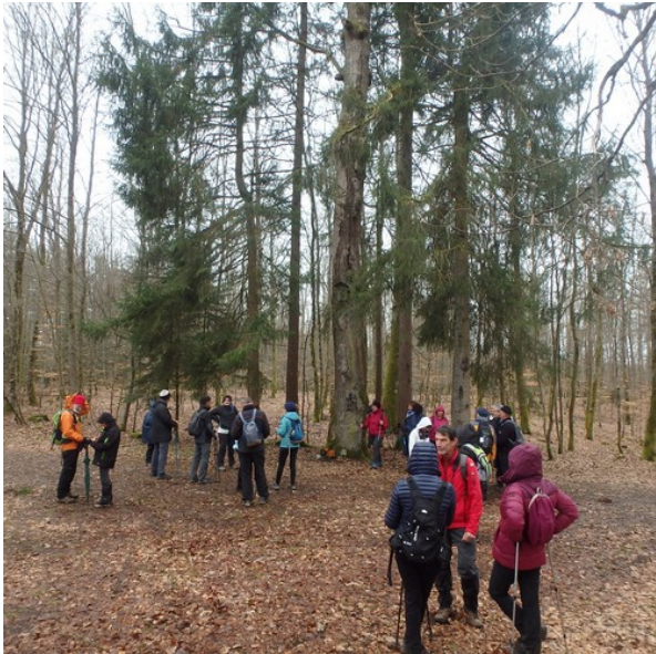
Le chêne de la Vierge.