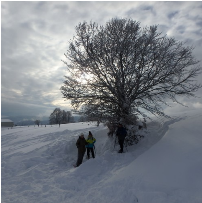
Avec un Inuit, à gauche , à côté du trio.