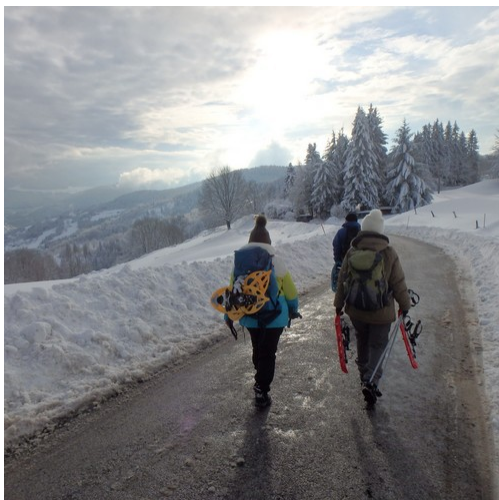
Et nous retrouvons la route.